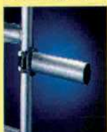
Wandabstandhalter bei Verwendung in Wandposition