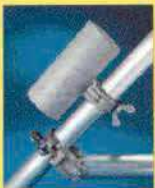
Ballastgewichte mit praktischer Anschraubkupplung, je 10 kg oder 20 kg.