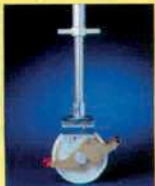
Spindel mit ca. 25 cm Höhenausgleich